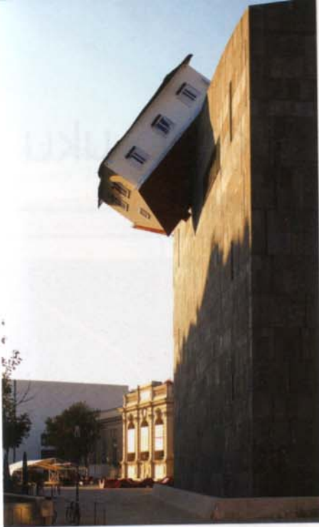
House Attack, 2006