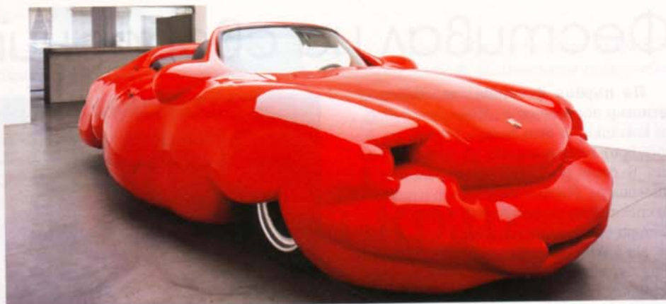
Fat Convertible, 2005

Според една от актуалните класации – в Artfacts.net , Ервин Вурм е на 41 място сред 100-те най-големи живи художници в света (основа за оценката е представянето в световни музеи и галерии). „Не съм се кандидатирали – смее се. – Сам се учудих на класирането при всички тези американци, англичани, германци с голямо влияние... Австрия е малка страна.” Малка страна с извест-